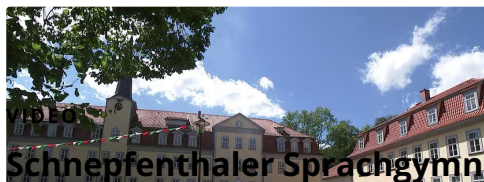
Schnepfenthaler Sprachgymnasium feiert 240. Jubiläum

Die Schüler der Salzmannschule waren vergangene Woche zu Atmosphärenforschern geworden. Die Aktion war Teil der Projektwoche zum 240. Geburtstag der Sprach-Schule.