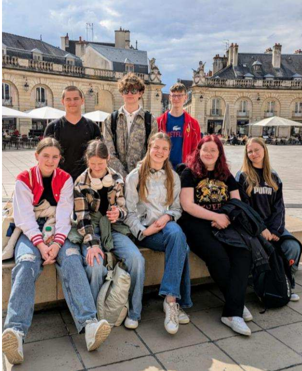
Unsere Gruppe auf dem Place de la Libération in Dijon