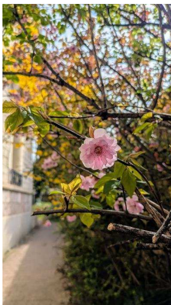
Frühling in Dijon

um 10:20 begann, hatten wir die Möglichkeit uns bei der Nähe gelegenen Bäckerei etwas zu essen zu holen. Diese Gelegenheit wurde (zumindest von mir) durchaus genutzt. Als der Unterricht für diesen Tag nun aber beendet war, hatten wir erst einmal ein wenig Zeit, um uns mit Essen zu versorgen. Dafür sind wir erst in einen Supermarkt gegangen und dann zum Rathaus, da man von dort aus alle umliegenden Restaurants sehr gut erreichen kann. Als unsere Mittagspause dann auch ein Ende fand, sollten